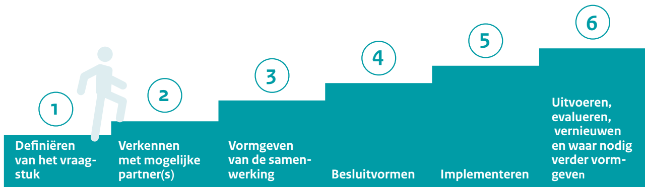
Figuur 3. Stappen in het samenwerkingsproces